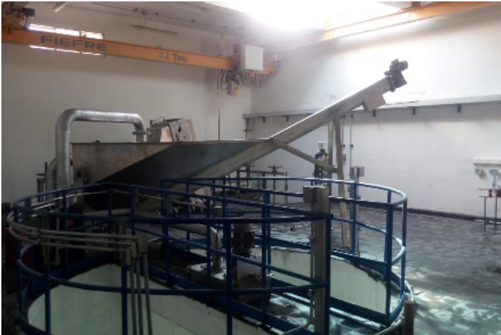
Diseño, fabricación y montaje Clasificador de Arena en Planta Guayacan, Coquimbo. Cliente: Aguas del Valle.