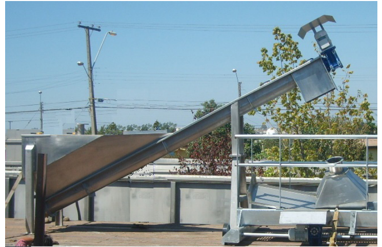
Diseño, fabricación y montaje Clasificador de Arena en Planta Coya. Cliente: Tecnorecursos.